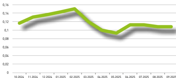
Grafico indice (12 mesi)