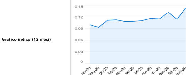
Grafico indice (12 mesi)

Altri Corrispettivi* | I valori aggiornati dei corrispettivi di dispacciamento, del mercato della capacità, della tariffa per l'uso della rete elettrica e degli oneri generali di sistema si possono consultare al seguente indirizzo: https://www.arera.it/consumatori