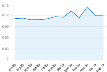
Grafico indice (12 mesi)